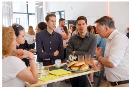
Austausch und Netzwerken unter Personalverantwortlichen von Vorarlbergs Unternehmen