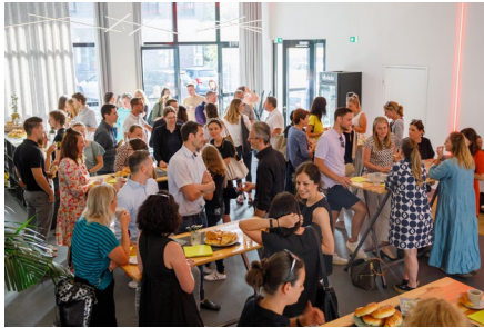
Reges Interesse beim ersten CHANCENLAND VORARLBERG Gipfe(r)