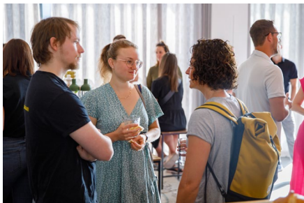
Austausch und Netzwerken unter Personalverantwortlichen von Vorarlbergs Unternehmen