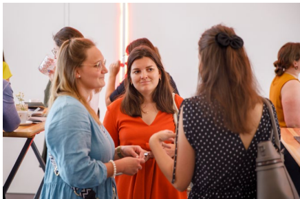
Austausch und Netzwerken unter Personalverantwortlichen von Vorarlbergs Unternehmen